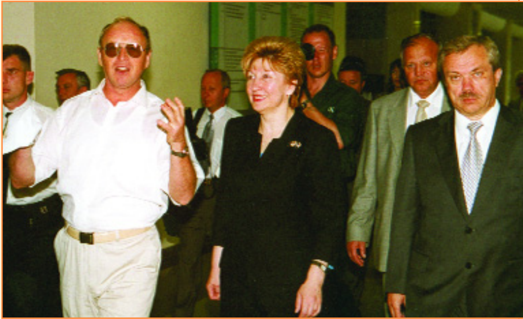
НА СНИМКЕ: экскурсия по университету

7 августа Белгород посетил с деловым визитом Председатель правления РАО ЕЭС России А.Б. Чубайс. Хотим напомнить нашим читателям, что энергетики России - ведущие попечители и спонсоры университета. Только на средства "Белгородэнерго" обновлен почти полностью компьютерный парк нашего вуза.