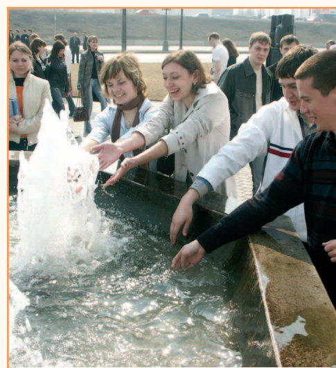
... теперь можно прикоснуться к журчащим струям фонтана

Архангел Гавриил выбран покровителем университета не случайно, ведь именно он научил Моисея книжному писанию, рассказал о начале мира и создании первого человека Адама, поведал ему о жизни и деяниях патриархов, рассказал о потопе и разделении языков, объяснил расположение небесных планет и стихий, научил арифметике, геометрии и всякой премудрости. Не правда ли, учение Архангела Гавриила похоже на то, которое дает наш университет?