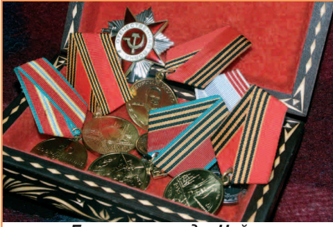
Боевые награды Чайки