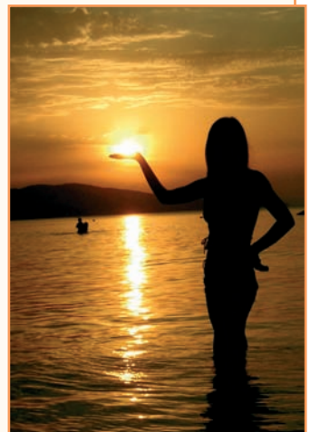
Вот так мы отдыхали на Черном море этим прекрасным летом