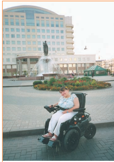
Надя благодарна за помощь