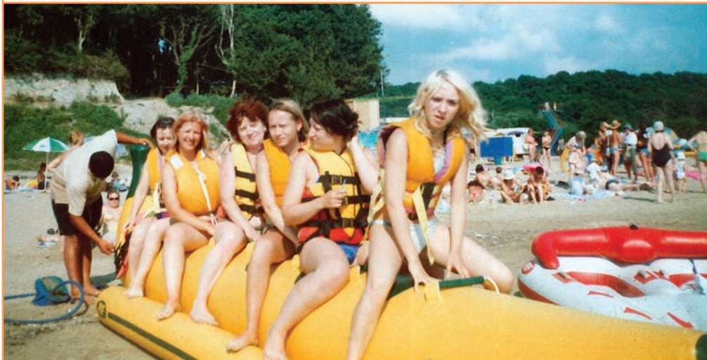
Преподаватели и студенты БелГУ отдыхают под Туапсе