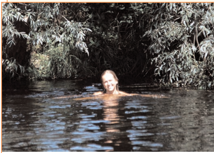
Вода в речке совсем прозрачная