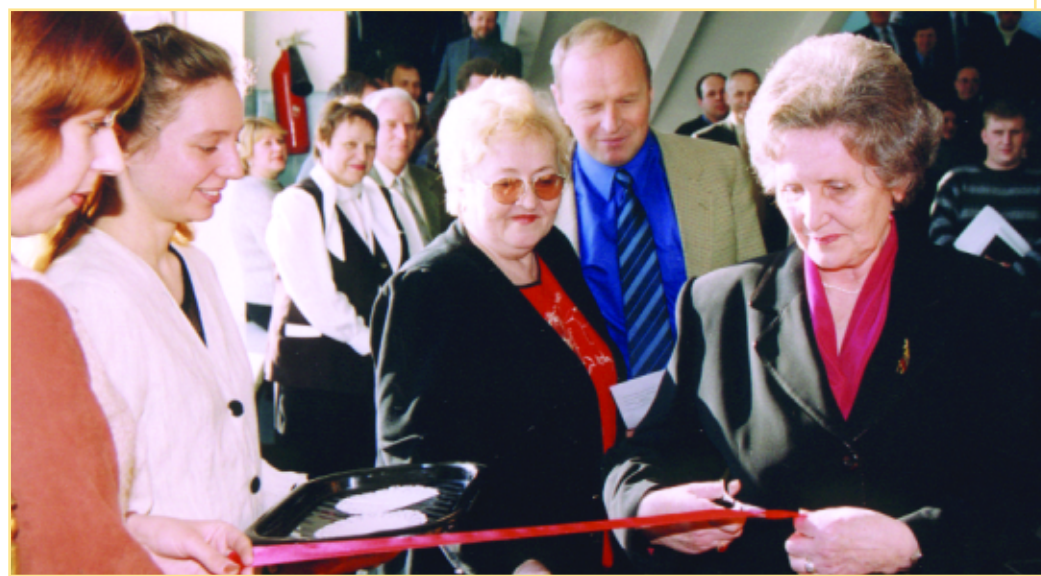
Л.ИГНАТОВА. На снимках: 322-ая аудитория и ее торжественное открытие.

Раздвигающиеся с пульта шторы, меняющаяся по желанию лектора освещенность (лампы на потолке вспыхивают то все разом, то рядами, то в шахматном порядке); магнитная доска, мультимедийный проектор, лазерные указки, голографические изображения, создающие полную иллюзию трехмерного пространства; линия связи на лазере и множество разнообразных приборов, в том числе и изготовленных