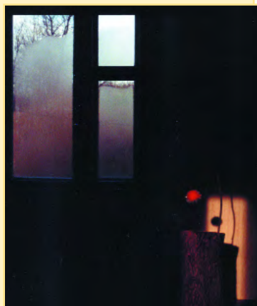
Работа В. САВЧЕНКО.

Н. НЕВЗОРОВА, к.ф.н., доцент, фотограф-любитель.