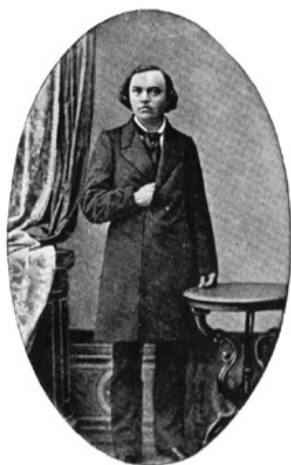
СТРАХОВ Николай Николаевич (1828 – 1896)