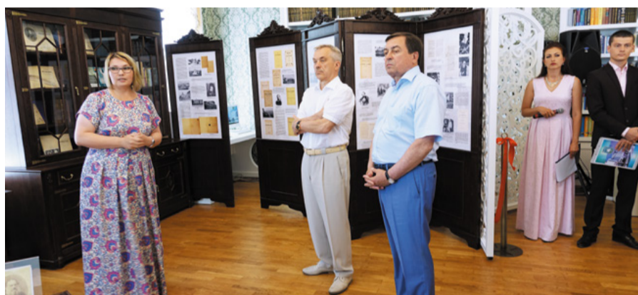
Открытие библиотеки-музея Н.Н. Страхова, 2017 г.

«Я сидел у него на коленях; он собрал несколько оторванных от хрип неисписанных четвертушек и сшил их in octavo шёлковую ниткой. Тетрадь эта очень меня обрадовала, хотя листы её были разной бумаги с кружками (от чайного стакана – Д.С.), о которых я говорил. Но верю, я ничего бы не помнил об этом, если бы при этом не было польщено моё самолюбие. Отец вышел со мною на крыльцо и стал упрекать брата за то, что тот всё бегаёт: хвалил меня, назвав умницей, и сказал, что у брата не будет такой тетрадки. Вот что первое я помню!»