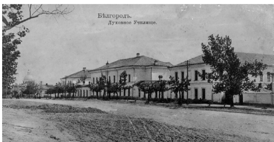
Белгород. Духовное Училище.

«Я родился от русской крови. Мой отец — духовного звания, а духовные наши — коренные русские. Но мать моего отца была гречанка; но я родился от малороссианки, которой дед был родовой казак, а мать из польского семейства. Сколько разнообразности влияний!»