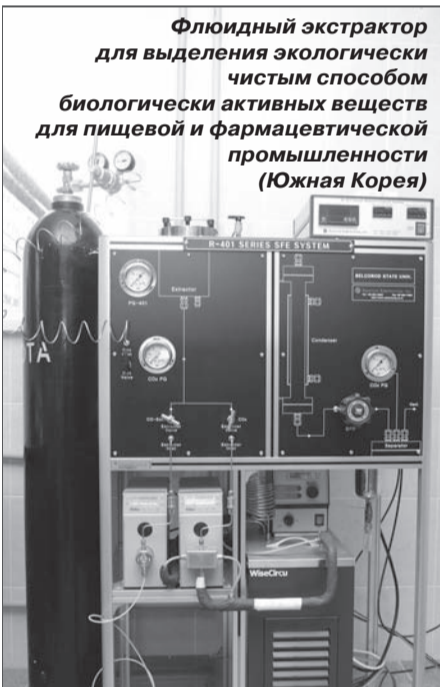
Флюидный экстрактор для выделения экологически чистым способом биологически активных веществ для пищевой и фармацевтической промышленности (Южная Корея)