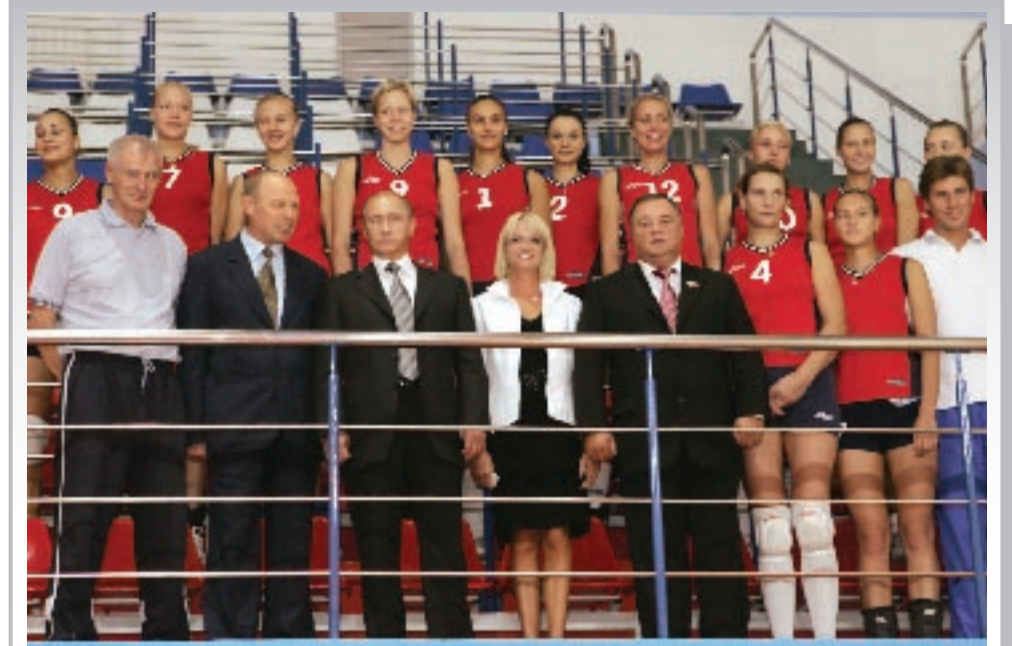
Не каждая команда удостоивается внимания Президента. Волейболистки команды «Университет-Белогорье» тренируются в прекрасно оснащенном игровом зале УСК Светланы Хоркиной

Кроме того, многие выпускники с успехом работают в научно-исследовательской сфере – в архивах, музеях, библиотеках города и области в качестве сотрудников и руководителей подразделений; в средствах массовой информации в качестве редакторов, журналистов; занимаются экспертно-аналитической деятельностью – работают экспертами общественных и государственных организаций;