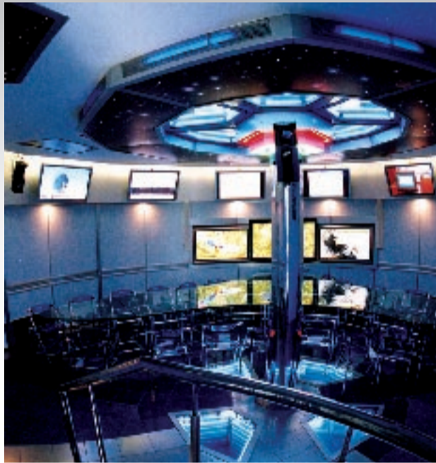
Федерально-региональный центр аэрокосмического мониторинга объектов и природных ресурсов

010707.65 «Медицинская физика». Квалификация выпускника – физик. Срок обучения – 5 лет. Специалист подготовлен к деятельности, требующей углубленной фундаментальной и профессиональной подготовки в области физики, а при условии освоения дополнительной образовательной программы – к деятельности в области медицины и педагогики. Виды профессиональной деятельности: научно-исследовательская, экспериментальная, теоретическая и расчетная. Сфера профессиональной деятельности – высшие учебные заведения, научно-исследовательские институты, лаборатории, конструкторские и проектные бюро и фирмы, производственные объединения и предприятия, учреждения системы высшего и среднего специального образования и лечебно-диагностические учреждения, клиники и госпитали, имеющие сложное современное наукоемкое оборудование.