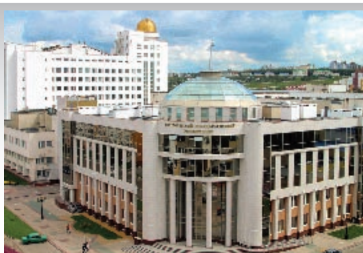
В этом корпусе учатся будущие журналисты, фармацевты, студенты международного факультета

С 2003 г. на факультете РГФ функционирует Научно-учебный центр иностранных языков (НУЦИЯ). Студенты любого факультета БелГУ могут получить дополнительную квалификацию – переводчик в сфере профессиональной коммуникации, обучаясь в НУЦИЯ. Обучение двухгодичное, осуществляется на договорной основе, зачисление производится по результатам собеседования. По окончании обучения выдается диплом государственного образца.