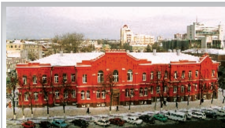
Здание социально-теологического факультета БелГУ - памятник архитектуры XIX века, охраняемый государством

Материально-техническая база факультета позволяет в полном объеме реализовать образовательные стандарты и весь комплекс научных и воспитательных задач.