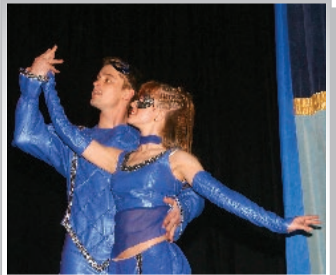
Выступают солисты популярного университетского коллектива «Dance Хаос»

Спортивно-оздоровительная работа на факультете проводится в рамках общеуниверситетских и факультетских мероприятий. На факультете создана команда по легкой атлетике, футболу, волейболу, баскетболу и шахматам.