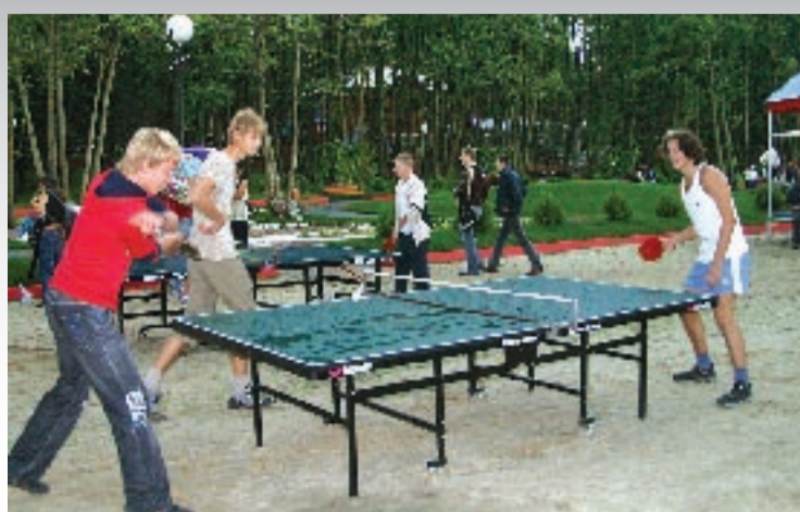
Настоящий студент и работает, и отдыхает со вкусом. В том числе и в природном парке БелГУ «Нежеголь», где воздух так чист и свеж