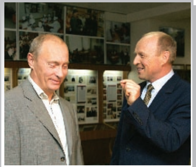
Президент России Владимир Путин - гость БелГУ

Если же вы только задумались о будущем, ищите наиболее востребованную профессию и знаете о переходе с 2009 года на двухступенчатое высшее образование (Болонский процесс). Тогда специально для вас на факультете МиИТ с 2009 года будет открыт бакалавриат по направлению 230100.62 «Информатика и вычислительная техника» . Вы сможете быть специалистом по созданию и применению: ЭВМ, систем и сетей; автоматизированных систем обработки информации и управления; систем