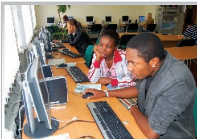
В библиотечном фонде более одного миллиона источников литературы в печатном и электронном виде

Выпускник по специальности «Налоги и налогообложение» может применять полученные знания и умения при работе в органах казначейства, органах налоговой полиции, на предприятиях и в организациях различных организационно-правовых форм и видов собственности, в государственных органах федерального, территориального и муниципального уровня на должностях, требу-