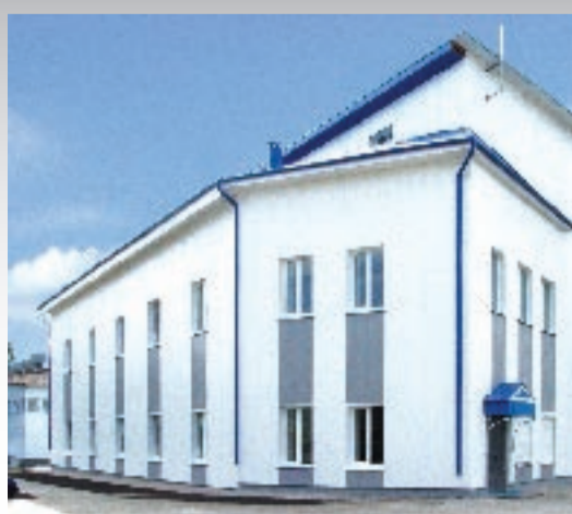
Центр наноструктурных материалов и технологий БелГУ