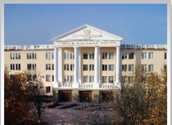
Классическая колоннада украсила вход в первый корпус БелГУ по улице Студенческой

организационно-управленческой – в органах федерального и регионального государственного управления, местного самоуправления Белгородской области, в системе органов внутренних дел, ГАИ, ФСБ, других силовых структурах.