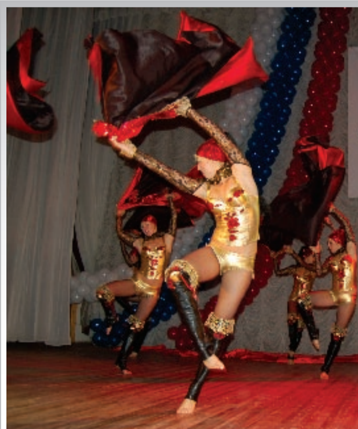
Выступление театра моды и танца «Стиль» всегда завораживает. Ничего удивительного: ведь перед нами - неоднократные победители чемпионатов мира по спортивным танцам

Имеющим профессиональное образование институт предлагает программы дополнительного образования по экономическим и управленческим специальностям. На базе института реализуется Президентская программа подготовки кадров для организаций народного хозяйства РФ. Для тех, кто стремится к достижениям в науке, есть возможность продолжить образование в аспирантуре и докторантуре.