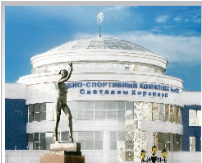
Учебно-спортивный комплекс Светланы Хоркиной не имеет аналогов ни в одном университете России

Учебный процесс осуществляют три кафедры: теории и