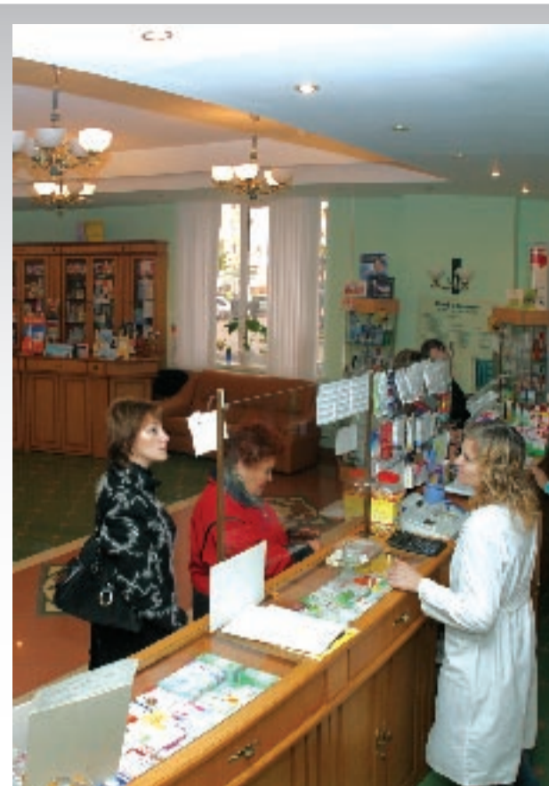
Аптека БелГУ - прекрасная учебно-производственная база для студентов-фармацевтов

В настоящее время обучение ведется на дневном и заочном отделениях на бюджетной и договорной основе. Осуществляется прием иностранных студентов.