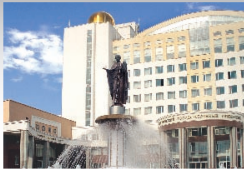
Главный корпус БелГУ - яркая достопримечательность нашего города

Областями профессионально-педагогической деятельности специализации, окончивших филологический факультет, являются: преподавательская, научно-методическая, социально-педагогическая, культурно-просветительская, научно-исследовательская, журналистская. Традиционно сильная практическая составляющая в работе факультета позволяет подготовить выпускника для работы в образовательных учреждениях, редакциях и библиотеках, сфере менеджмента, издательского дела и редактирования, связей с общественностью. Выпускники филологического факультета работают в разных уголках России, находя разнообразное применение полученным в процессе обучения знаниям и умениям.