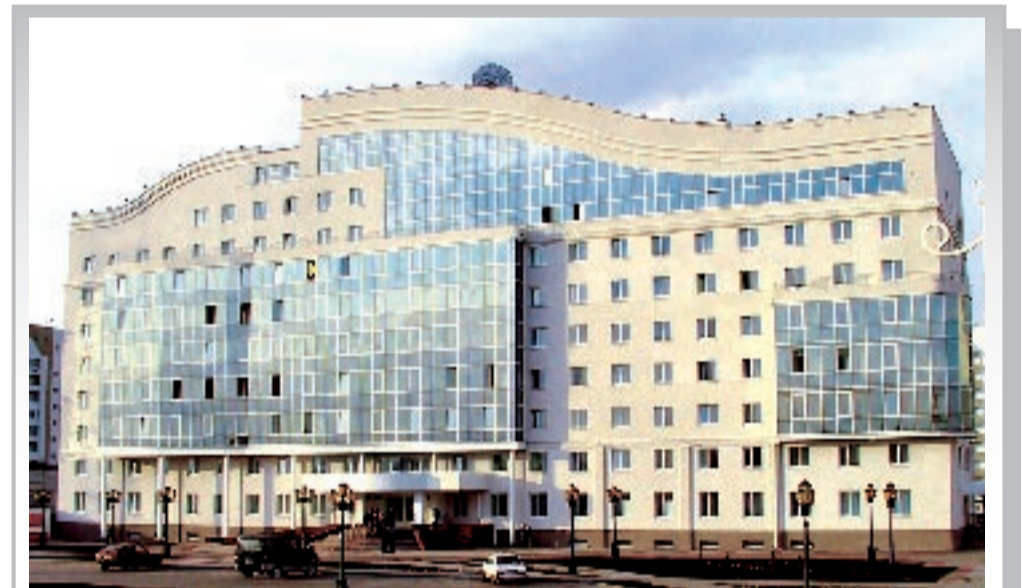
«Пятизвездочный отель» - так, не шутя, называют белгородцы новое общежитие нашего университета

Имеются все основания для утверждения, что условия обучения на факультете отвечают требованиям самых взыскательных абитуриентов, рассчитывающих получить современный уровень профессиональной подготовки. Именно их мы рассматриваем в качестве желанного пополнения корпорации по имени КНиТ.