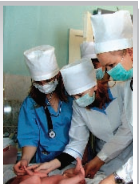
Студенты-медики практикуются в больницах под руководством высококвалифицированных врачей

Специальность 060109 «Сестринское дело» существует в БелГУ с 2003 г. – это новое направление подготовки кадров здравоохранения – менеджеров сестринского дела. Новая специальность выполняет