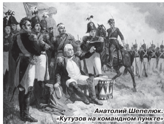
Анатолий Шепелюк. «Кутузов на командном пункте»

века: Святослава, Дмитрия Донского, Петра I, Суворова, и его восклицание «Но дух отцов воскрес в сынах!» связывает прошлое с настоящим. Это настоящее воплощено в портретах героев 1812 г.: Кутузова, Багратиона, Ермолова, Милорадовича, Раевского, Фигнера, Дениса Давыдова.