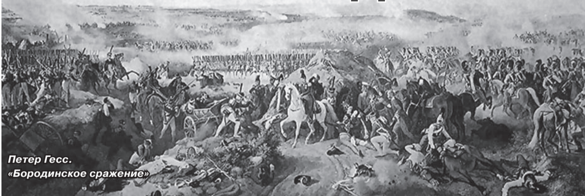
Петер Гесс. «Бородинское сражение»

солдат и офицеров. Ей противостояла русская армия в 210 тысяч.