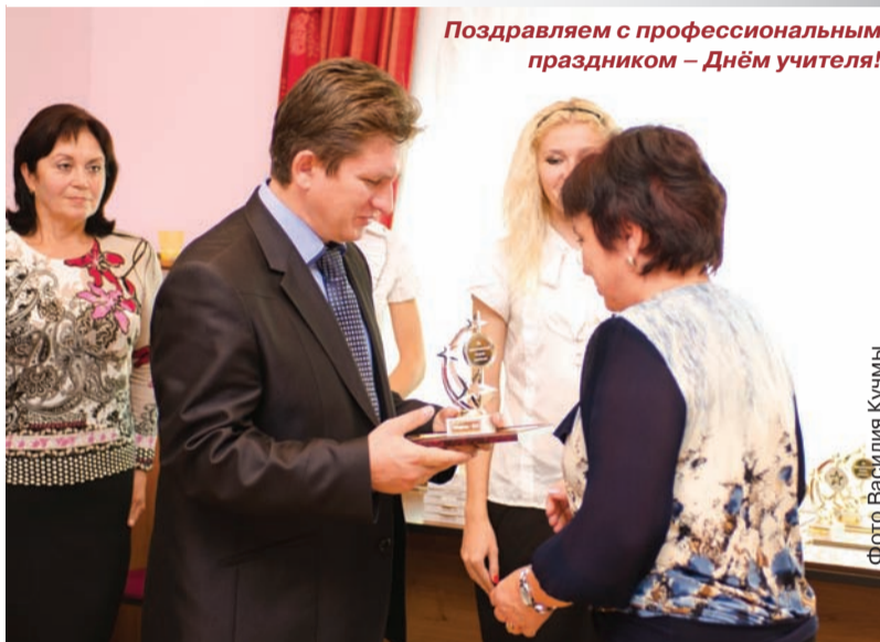
Поздравляем с профессиональным праздником – Днём учителя!

Всероссийский конкурс в области педагогики, воспитания и работы с детьми и молодёжью на соискание премии «За нравственный подвиг учителя» направлен на укрепление взаимодействия светской и церковной систем образования по духовно-нравственному воспитанию и образованию детей и молодёжи, повышение престижа учительской профессии.