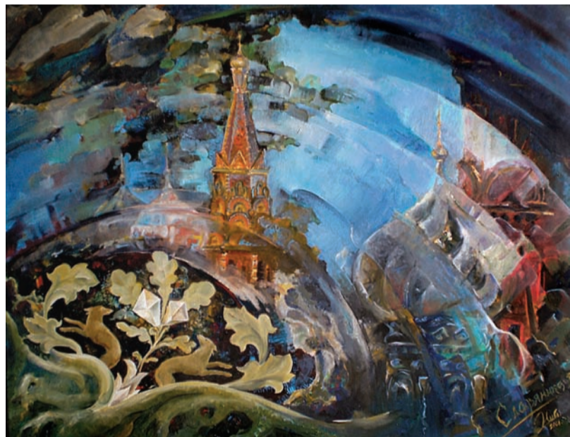
«У Чаши неотпитой» (родник в Тверской области)

заведующая сектором периодики Научной библиотеки НИУ «БелГУ»