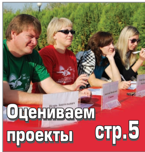
Оцениваем проекты стр.5