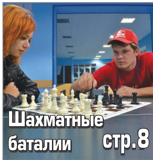
Шахматные баталии стр.8