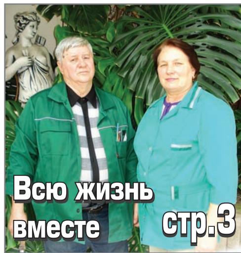
Всю жизнь вместе стр.3