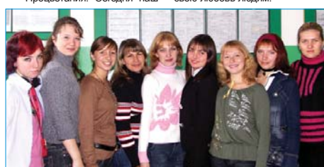
Наши студенты - дружные и веселые.

факультет - это одна большая дружная семья. Пусть и дальше на педфаке царят любовь и уважение преподавателей и студентов, выпускников и их воспитанников. Пусть нас все любят так же, как мы бескорыстно дарим свою любовь людям.