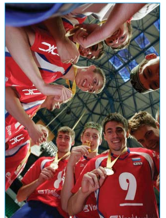
На снимке: победительница Чемпионата Европы молодежная сборная России