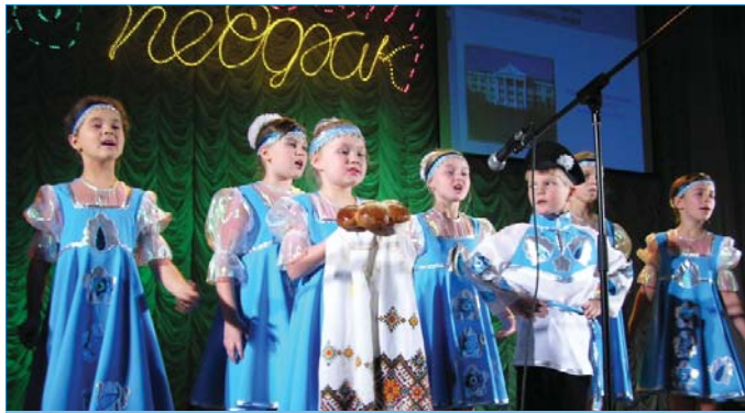
Поздравления малышей - самый дорогой подарок для юбиляров

Традиционно педагогический факультет проводит благотворительные акции "Каждому ребенку - игрушку в подарок". Ежегодно - в Белгородском областном специализированном доме ребенка, а в 2005 г. акция проводилась и в гематологическом отделении Белгородской областной детской больницы. Студенты факультета шефствуют над Прохоровским интернатом для мальчиков.