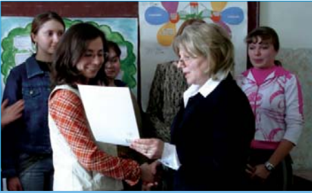
Посвящение первокурсников в профессию