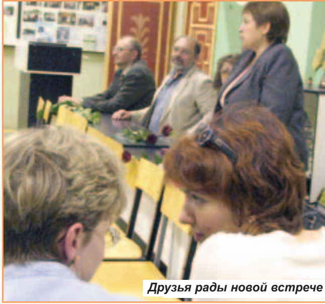
Друзья рады новой встрече