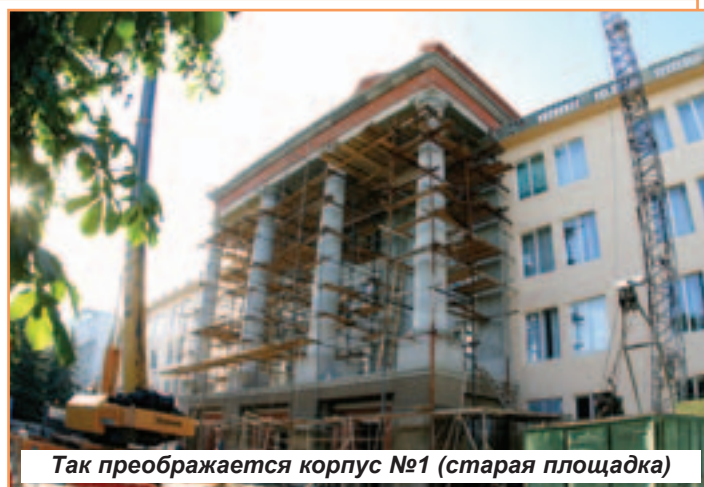
Так преобразуется корпус №1 (старая площадка)

Идея создания законченного ансамбля зданий принадлежит нашему ректору, профессору Л.Я. Дятченко. Именно Леонид Яковлевич убедил Попечительский совет выделить средства на строительство нового корпуса. Завершение строительства этого здания позволит создать в университете еще один уютный внутренний дворик для отдыха сту-