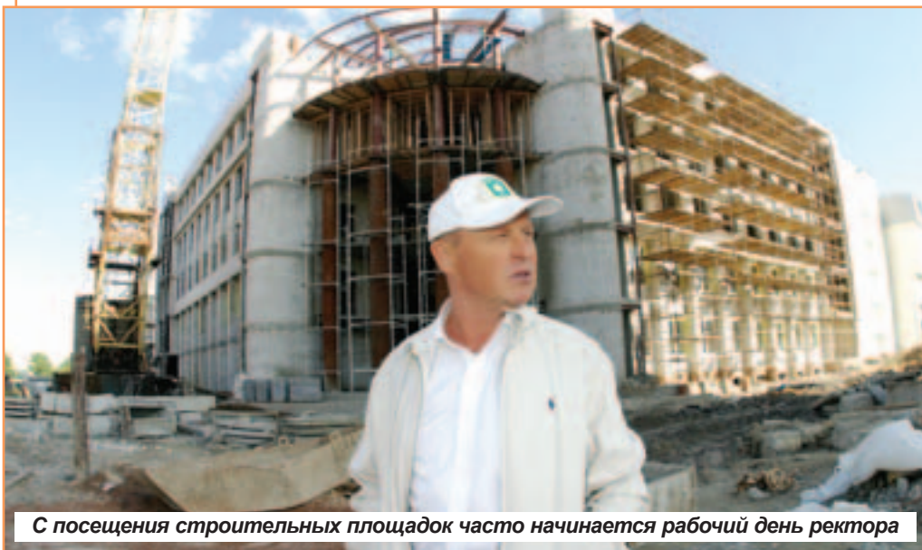
С посещения строительных площадок часто начинается рабочий день ректора

1 сентября - День знаний. Начинается новый учебный год, для кого-то первый в нашем вузе, для кого-то сорок первый, но каждый из нас, от первокурсника до седовласого профессора, встречает его с радостью и надеждой. Нас ждет немало замечательных событий в этом году!