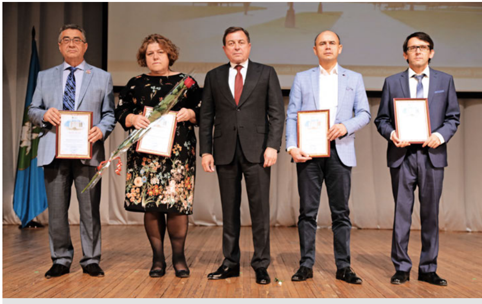
Победители на соискание премии имени Н.Н. Страхова и А.В. Погорелова