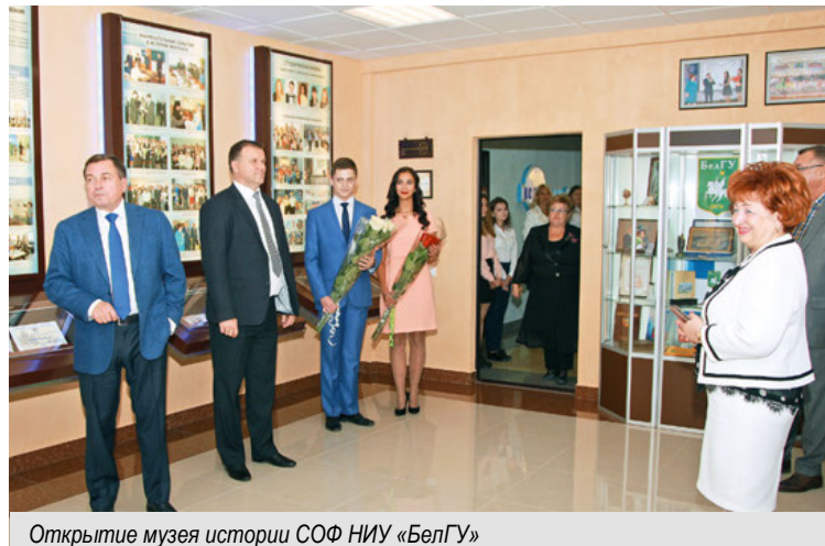
Открытие музея истории СОФ НИУ «БелГУ»

– Самое главное – мы сумели сформировать высокопрофессиональный профессорско-преподавательский коллектив, способный работать в условиях постоянно меняющихся требований к высшему