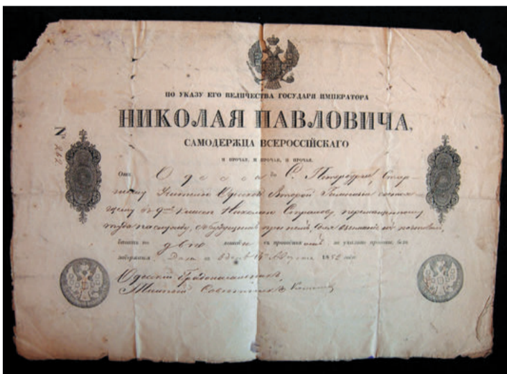
Подорожная от Одессы до С. Петербурга старшему учителю Одесской второй гимназии Николаю Страхову, перемещённому туда на службу. (Публикуется впервые)