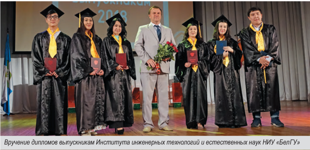
Вручение дипломов выпускникам Института инженерных технологий и естественных наук НИУ «БелГУ»