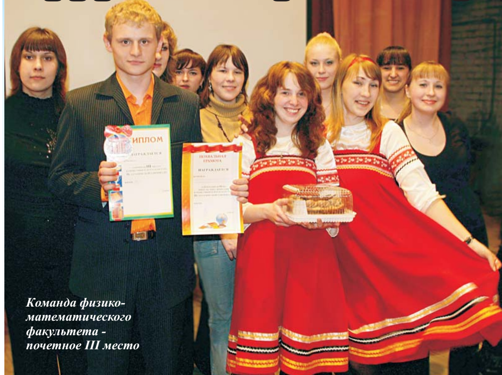
Команда физико-математического факультета - почетное III место

С решительным настроем на победу семь факультетских команд открыли первый теоретический тур олимпиады.