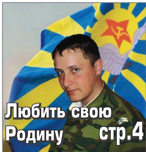
Любить свою Родину стр.4