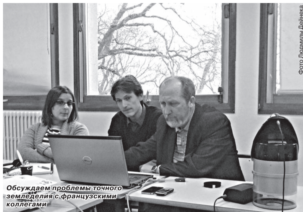
Обсуждаем проблемы точного земледелия с французскими коллегами

С компанией ФОРСЕ-А сложились тесные отношения, ведется постоянная переписка и компания предоставляет всю необходимую