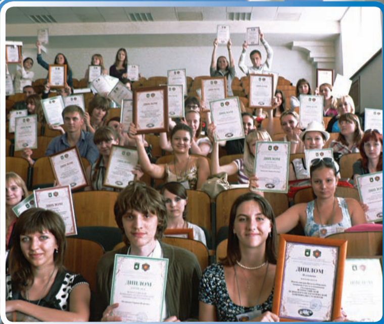
Всероссийская психолого-педагогическая олимпиада (2012 год) – белгородцы в числе лучших!