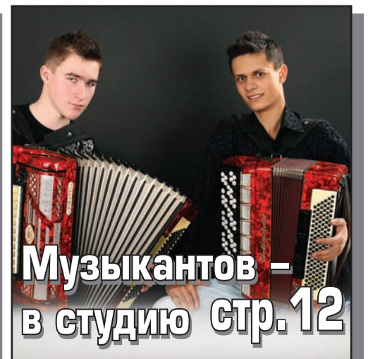
Музыкантов – в студию стр.12