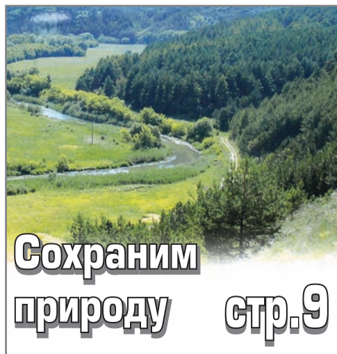
Сохраним природу стр.9