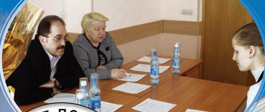
Ответственный момент – идёт государственный экзамен

Факультет психологии является одним из самых молодых и активно развивающихся факультетов университета. 7 февраля 2013 года ему исполнилось 8 лет.