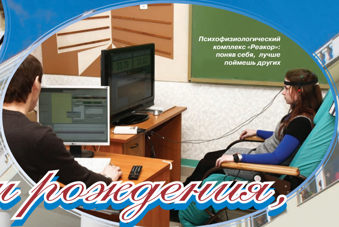
Психофизиологический комплекс «Реакор»: поняв себя, лучше поймешь других

Факультет психологии является одним из самых молодых и активно развивающихся факультетов университета. 7 февраля 2013 года ему исполнилось 8 лет.