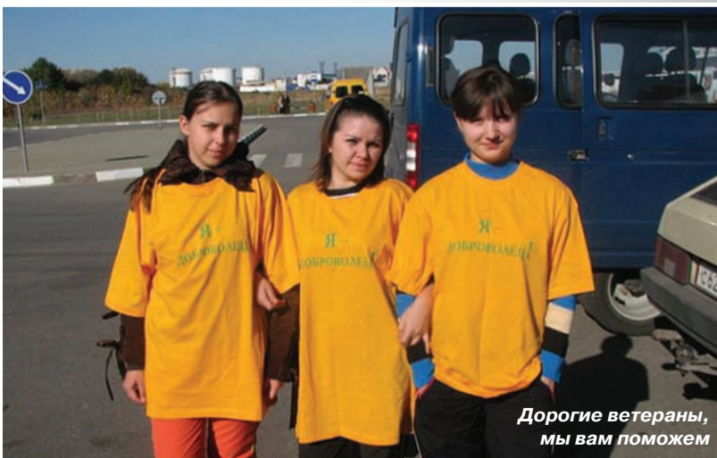
Дорогие ветераны, мы вам поможем

«По зову сердца» – волонтерская организация социально-теологического факультета НИУ «БелГУ», основа и желание которой – помочь ближнему, – активно действует четвертый год.