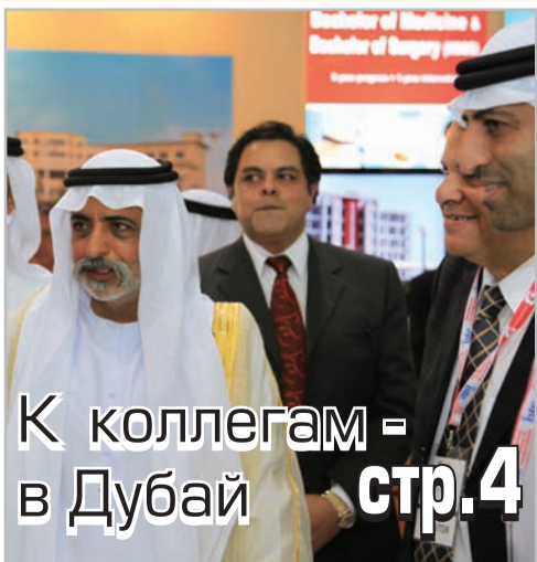
К коллегам в Дубай стр.4