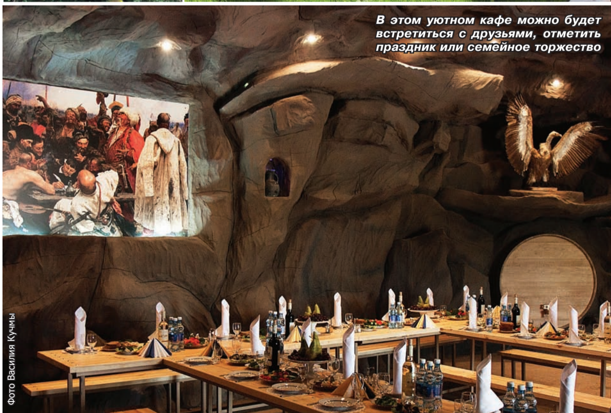
В этом уютном кафе можно будет встретиться с друзьями, отметить праздник или семейное торжество