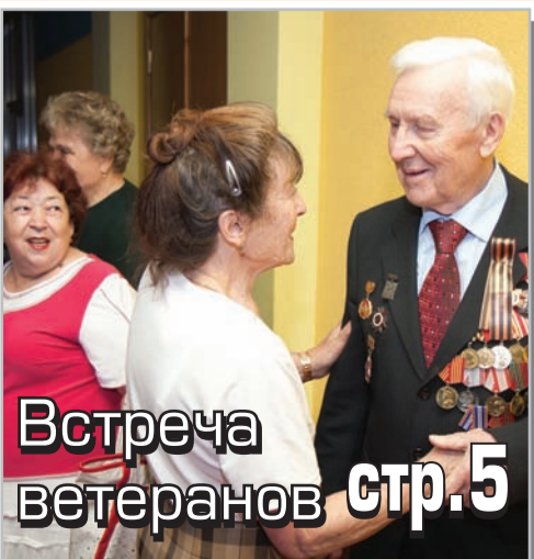
Встреча ветеранов стр.5