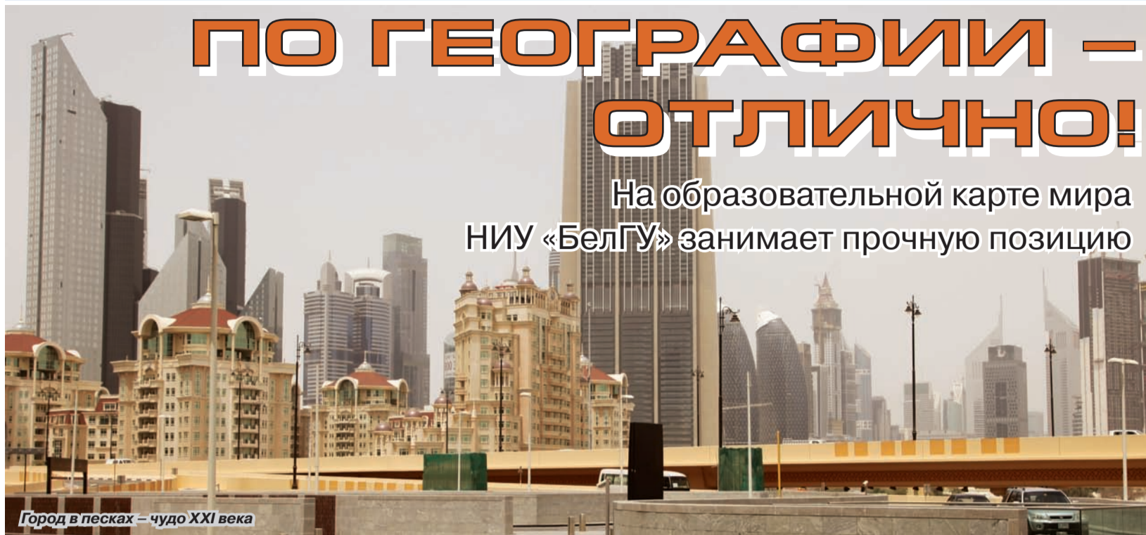
Город в песках – чудо XXI века

На образовательной карте мира НИУ «БелГУ» занимает прочную позицию