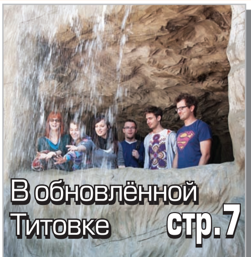
В обновлённой Титовке стр.7