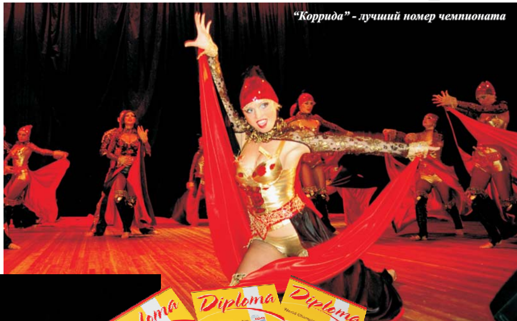
«Коррида» - лучший номер чемпионата