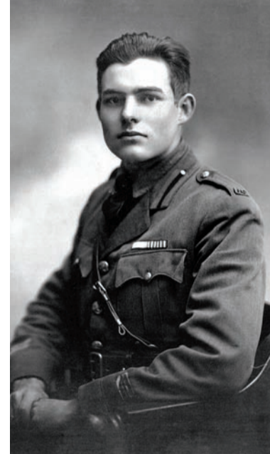
Эрнест Миллер ХЕМИНГУЭЙ

английского писателя Ричарда Олдингтона, ушедшего добровольцем на фронт. Вернувшись, он издал сборники стихов «Образы войны» и «Образы желаний». В первом и лучшем романе «Смерть героя», написанном в 1929 году, писатель подверг резкой критике Англию военных лет, показал безумие и