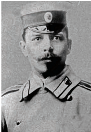
Алексей Николаевич ТОЛСТОЙ

преступность войны. Судьбы «потерянного поколения» нашли отражение и в творчестве американского писателя Эрнеста Хемингуэя. Роман «Прощай, оружие» написан от первого лица, участника военных событий. Война с её хаосом, бессмысленностью и грязью проти-