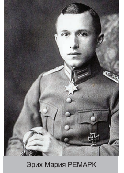
Эрих Мария РЕМАРК

Суровую правду о войне отразил в своих романах и немец Ремарк. Его известный роман «На Западном фронте без перемен» написан на основе собственных переживаний участника военных действий. Сначала герои Ремарка думают, что воюют за родину, но вот приходит прозрение, противник, казавшийся врагом, перестаёт таковым быть. Главный герой рома-