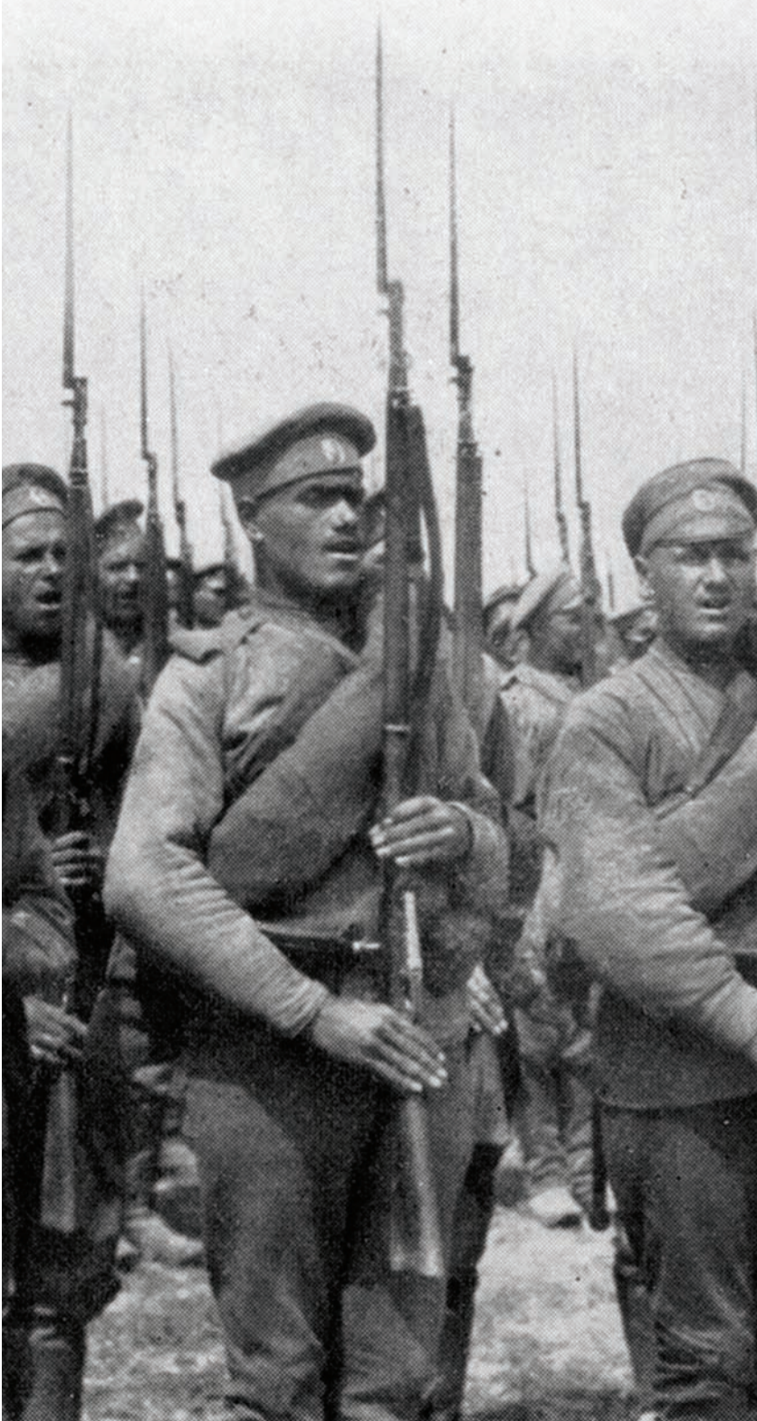
Русские солдаты в Первой мировой войне

Мировая война оказалась, однако, войной против всех сколько-нибудь значительных привычек челове-