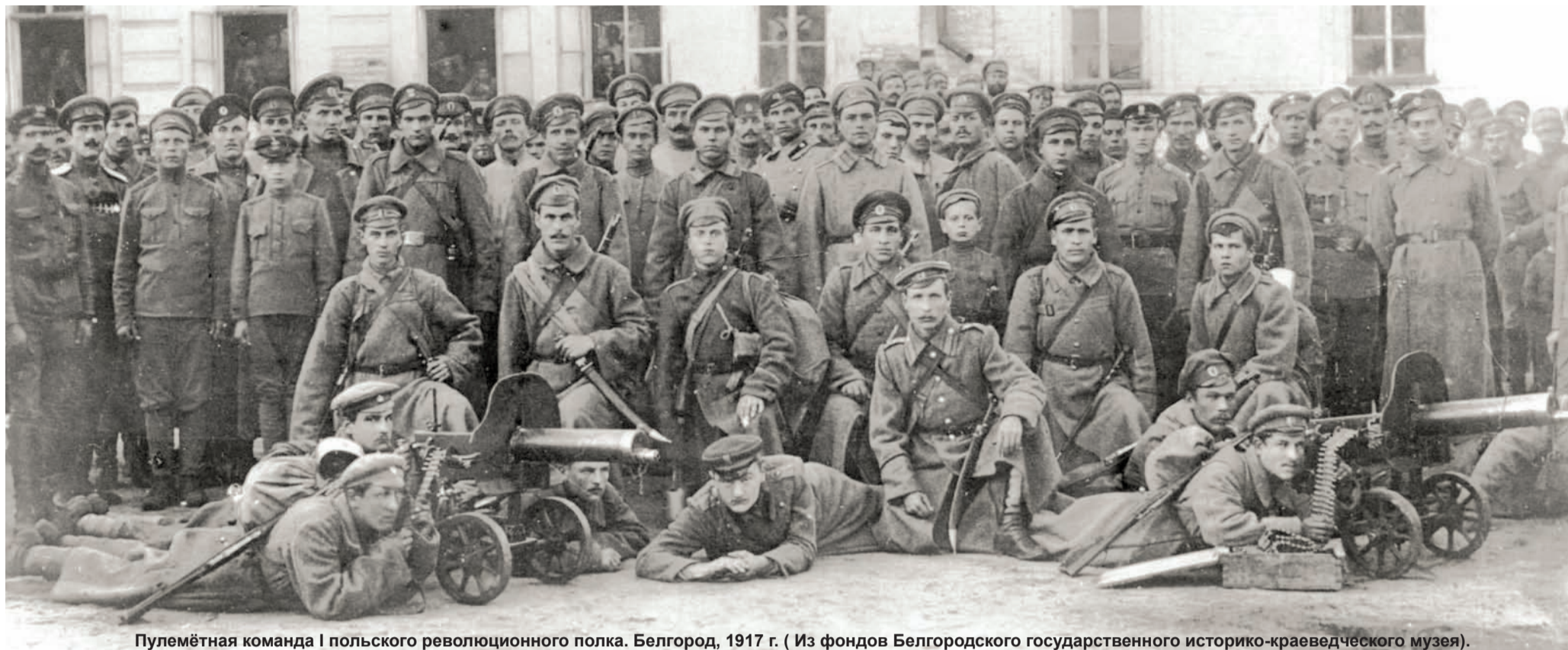
Пулемётная команда I польского революционного полка. Белгород, 1917 г.