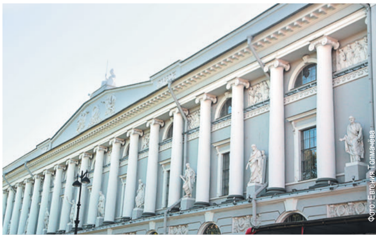
Императорская публичная библиотека Санкт-Петербурга, фото 2018 года