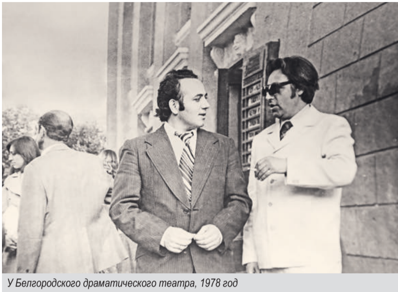
У Белгородского драматического театра, 1978 год