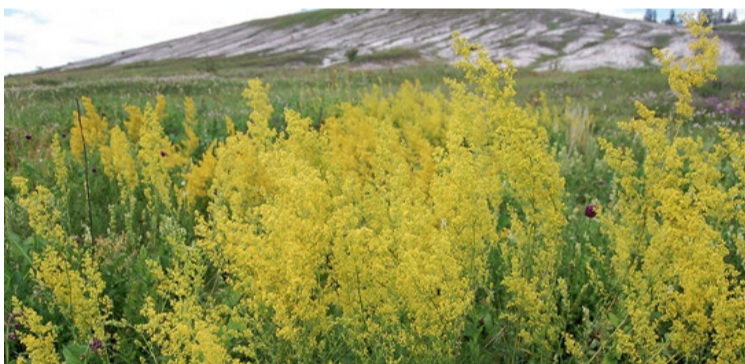
Луговая степь в июле становится золотой... Цветение подмаренника настоящего (с. Слоновка, Новооскольский район)

Участок «Ямская степь» расположен в 12-ти км к юго-западу от Губкина. Это эталон степных экосистем Евразии, единственный в мире крупный плакорный массив типичной зональной целинной ковыльно-