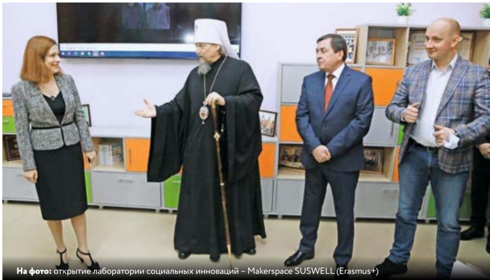
На фото: открытие лаборатории социальных инноваций – Makerspace SUSWELL (Erasmus+)