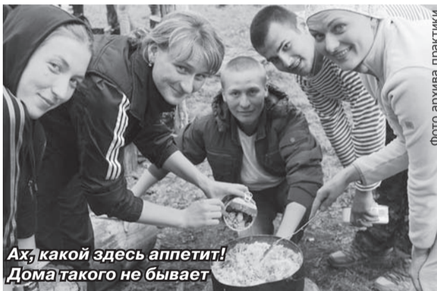
Ах, какой здесь аппетит! Дома такого не бывает

Пробыв на Телецком озере пять дней, мы отправились по Чуйскому тракту и совершили трудный подъём в горы на высоту более 2000 метров, где расположились невиданной красоты Каракольские озёра. Вода в них очень холодная, так как озёра наполняются тающими ледниками, лежащими на вершинах. Преодолев Семинский перевал и Чуйский тракт, мы добрались до границы природно-этнического парка Уч-Энмек. Разбив