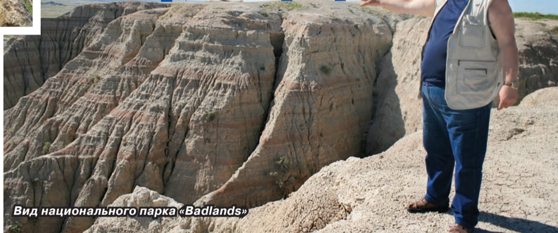
Вид национального парка «Badlands»

● С 1 сентября в музее истории НИУ «БелГУ» открывается фотовыставка профессоров Александра Петина и Юрия Чендева, чьи работы использованы в этой полосе. Предложенная экспозиция познакомит вас с красотами природы Америки.