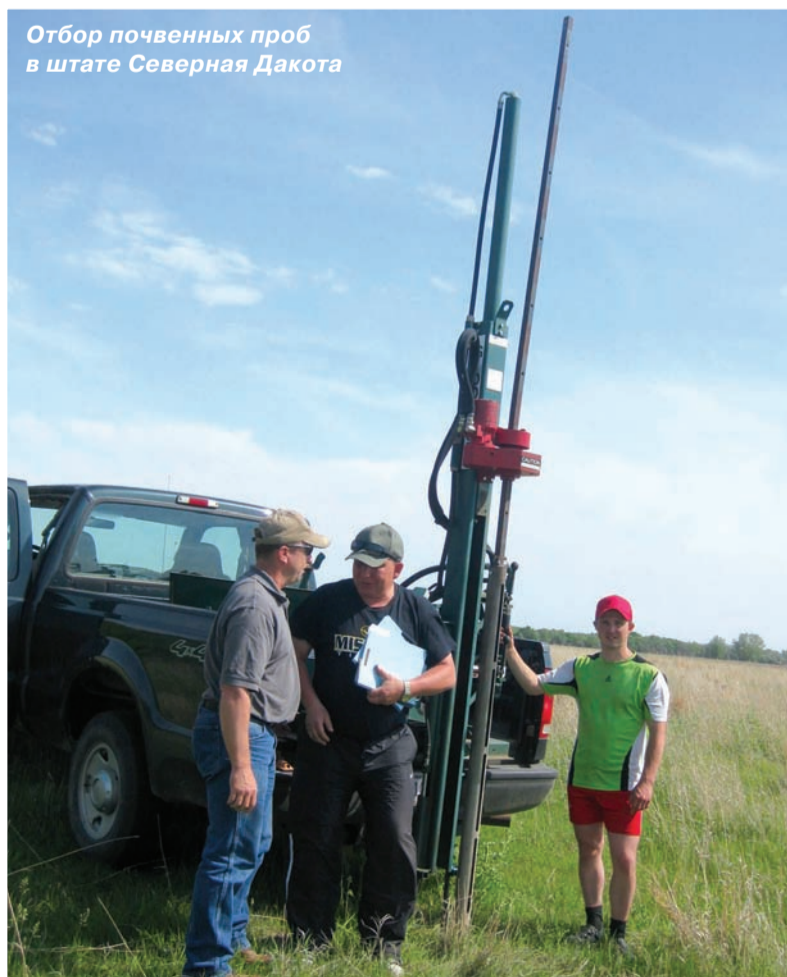
Отбор почвенных проб в штате Северная Дакота