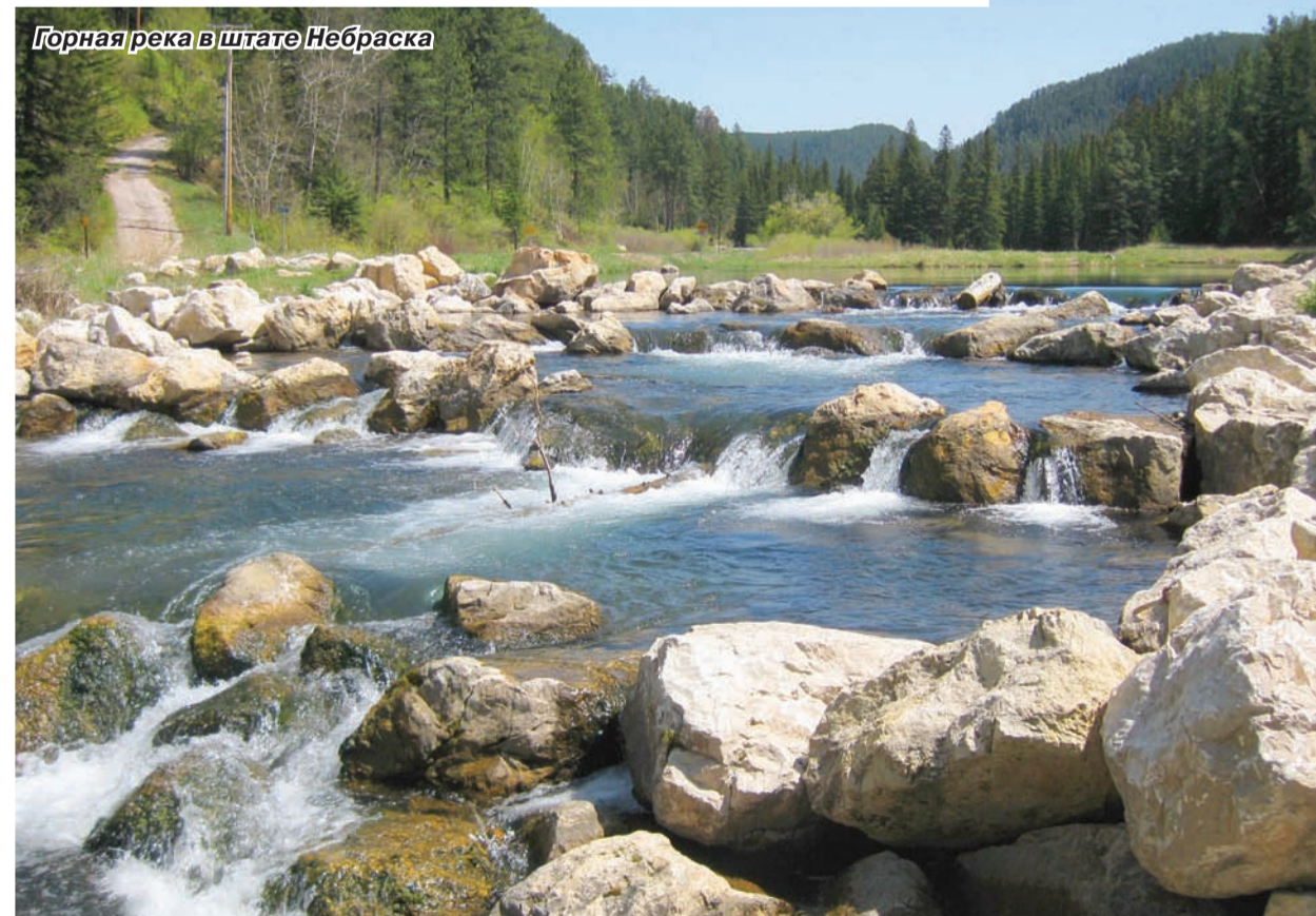
Горная река в штате Небраска