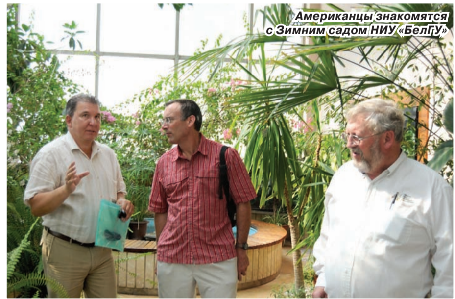
Американцы знакомятся с Зимним садом НИУ «БелГУ»