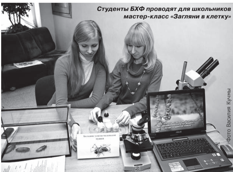
Студенты БХФ проводят для школьников мастер-класс «Загляни в клетку»

Только за несколько месяцев реализации Программы было проведено около 1500 мероприятий,