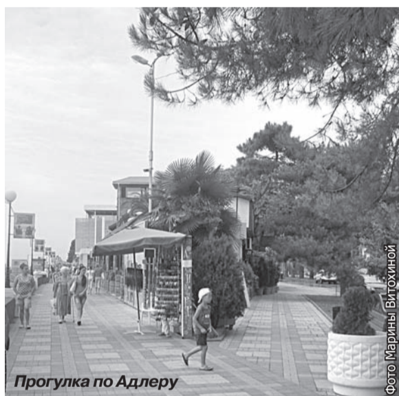
Прогулка по Адлеру

С прошлого года для сотрудников и профессорско-преподавательского состава НИУ «БелГУ» Адлер превратился из простого курортного района Большого Сочи в сказочно красивое место для летнего отпуска. Адлер – это великолепные южные пейзажи, богатая культура и масса интересных исторических мест. Что ещё нужно для отличного отдыха?