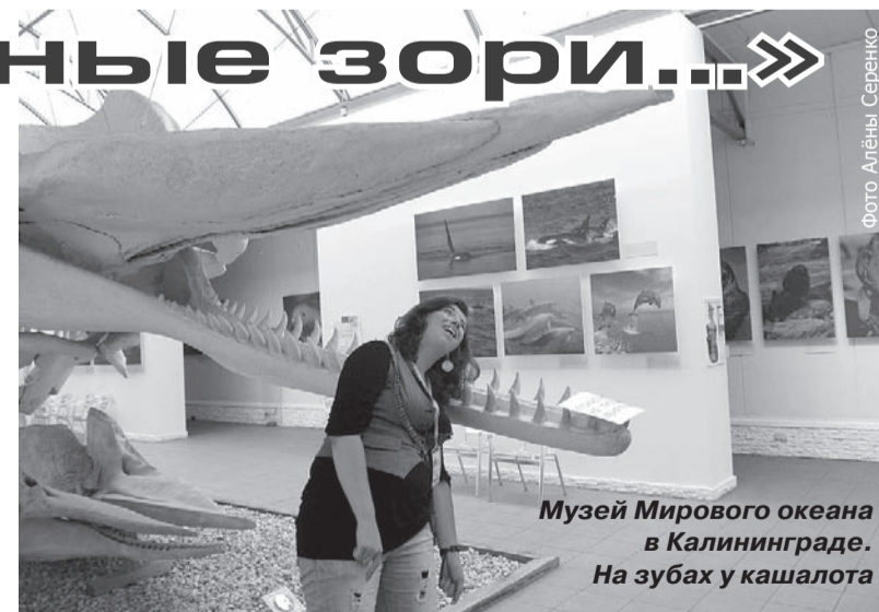
Музей Мирового океана в Калининграде. На зубах и кашалота

Сейчас, когда уже все волнения позади, мы можем с полной уверенностью заявить, что «Балтийский Артек» – не просто лагерь, расположенный в живописном месте на побережье Балтийского моря. Это уникальный форум, объединяющий более 2000 молодых людей из России и зарубежья, это возможность познакомиться с историей и культурой России в целом