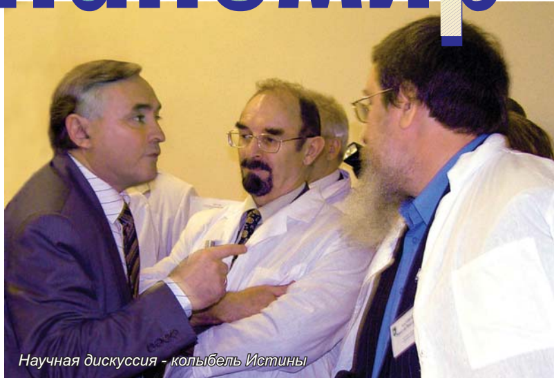
Научная дискуссия - колыбель Истины