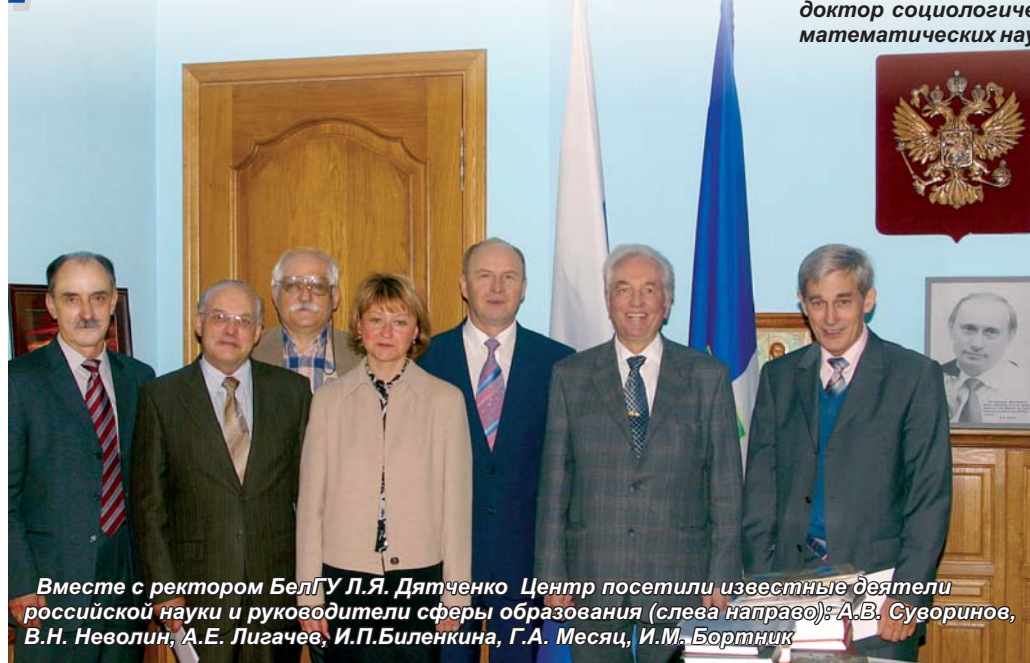
Вместе с ректором БелГУ Л.Я. Дятченко Центр посетили известные деятели российской науки и руководители сферы образования (слева направо): А.В. Суворин, В.Н. Неволин, А.Е. Лигачев, И.П. Биленкина, Г.А. Месяц, И.М. Бортник

Центр наноструктурных материалов и нанотехнологий размещается в современном двухэтажном здании, построенном в рекордно короткие сроки (около 8 месяцев). Он оснащен современным уникальным аналитическим оборудованием для проведения научно-исследовательских работ в области физического материаловедения. Центр также имеет участок для производства опытных партий наноструктурного титана. Гордость Центра - единственный в России по уровню комплектации растровый ионно-электронный микроскоп "Quanta 200 3D" стоимостью около 1 миллиона евро, предназначенный для проведения исследований в области физики конденсированного состояния, металловедения, химии, биологии и медицины.