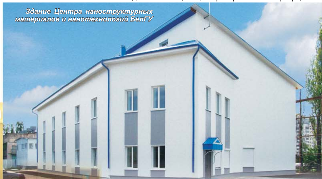
Здание Центра наноструктурных материалов и нанотехнологий БелГУ

день не однажды сравнивали с реформатором Петром I и сошлись во мнении, что новый Центр символизирует торжество российской науки. Г.А. Месяц, вице-президент РАН, отметил, что ни в одном из регионов России он не сталкивался с таким вниманием властей к науке, как в Белгороде. Сегодня просто необходимо развивать науку в регионах, и наш город - достойный пример правильного отношения к делу.