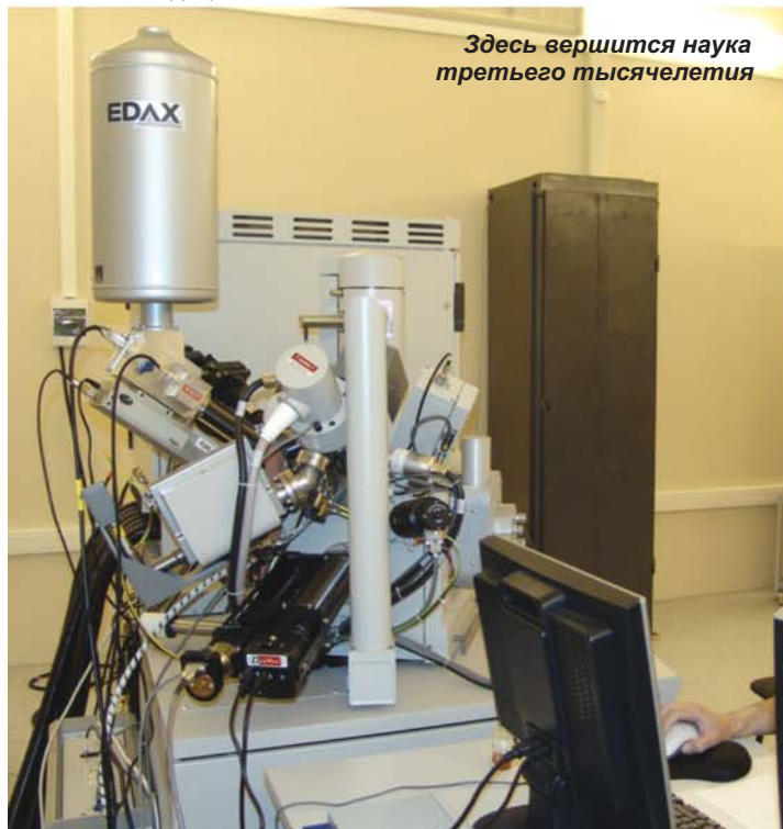
Здесь вершится наука третьего тысячелетия

Центр наноструктурных материалов и нанотехнологий размещается в современном двухэтажном здании, построенном в рекордно короткие сроки (около 8 месяцев). Он оснащен современным уникальным аналитическим оборудованием для проведения научно-исследовательских работ в области физического материаловедения. Центр также имеет участок для производства опытных партий наноструктурного титана. Гордость Центра - единственный в России по уровню комплектации растровый ионно-электронный микроскоп "Quanta 200 3D" стоимостью около 1 миллиона евро, предназначенный для проведения исследований в области физики конденсированного состояния, металловедения, химии, биологии и медицины.